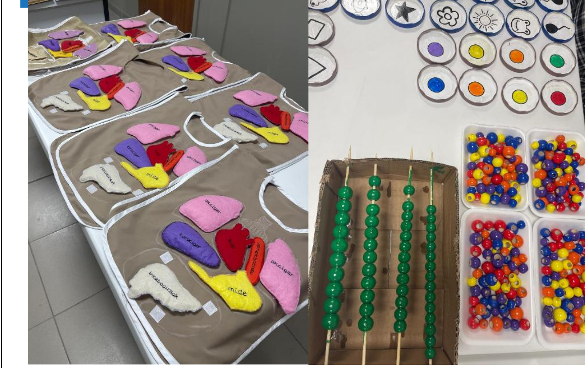
Proje Sunumu ve Materyal Sergisi'ne İlişkin Görseller (17.02.2026)